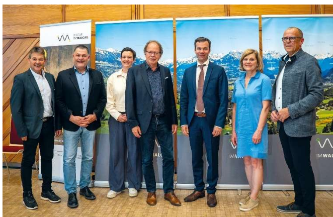
Gemeinden, Land und VGV für eine starke regionale Entwicklung.

Das Jahr 2025 brachte gleich mehrere Veränderungen: In drei Gemeinden wurden neue Bürgermeister gewählt, und an der Regio-Spitze erfolgte ein Obmann-Wechsel.